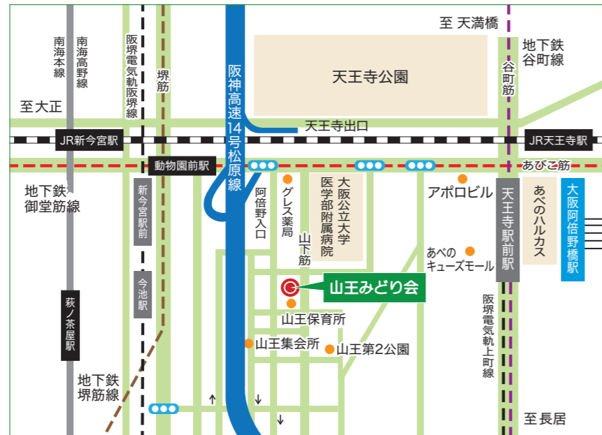
大阪メトロ御堂筋線「動物園前」駅2番出口から徒歩約5分/大阪メトロ御堂筋線「天王寺」駅14番出口から徒歩約10分 JR西日本「天王寺」駅南口から徒歩約10分/近鉄南大阪線「大阪阿部野橋」駅から徒歩約10分

高齢化や多文化共生、防災などの課題に向き合いながら、 社会福祉法人としての使命を大切に歩み続けます。 お地蔵様や石畳、歴史ある長屋や大衆演劇が息づく魅力的な山王のまちが、 これからも暮らしやすい地域であるよう、努めてまいります。